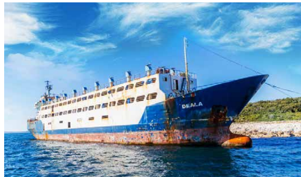
Brod duljine 79 metara nasukao se 16. travnja 2024. godine, svega četrdesetak metara od obale, na dubini od dva do pet metara

Općinsko vijeće Općine Barban uputilo je krajem siječnja jasan apel Ministarstvu mora, prometa i infrastrukture zbog nasukanog broda "Deala", koji već mjesecima predstavlja ozbiljnu prijetnju prirodi, sigurnosti ljudi i turizmu na području Raškog zaljeva: „Tražimo žurno i konkretno rješenje Ministarstva kako bi zaštitili ljude i prirodu!“ Brod duljine 79 metara nasukao se 16. travnja 2024. godine, svega četrdesetak metara od obale, na dubini od dva do pet metara. Iako su nakon incidenta poduzeti inicijalni koraci, uključujući postavljanje zaštitnih brana i sidrenje broda kako bi se spriječilo njegovo pomicanje, stanje broda se s vremenom značajno pogoršalo. „Unatoč tome što je raspisan natječaj za prvu fazu sanacije, koja je uključivala is-