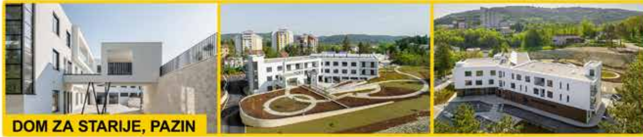
DOM ZA STARIJE, PAZIN