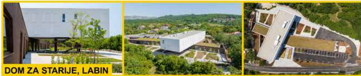
DOM ZA STARIJE, LABIN