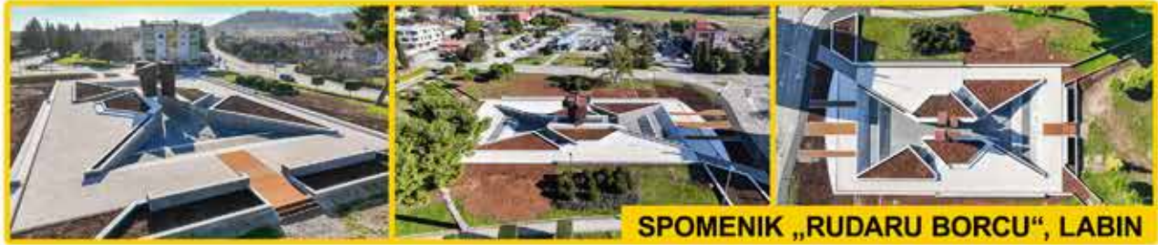
SPOMENIK „RUDARU BORCU“, LABIN