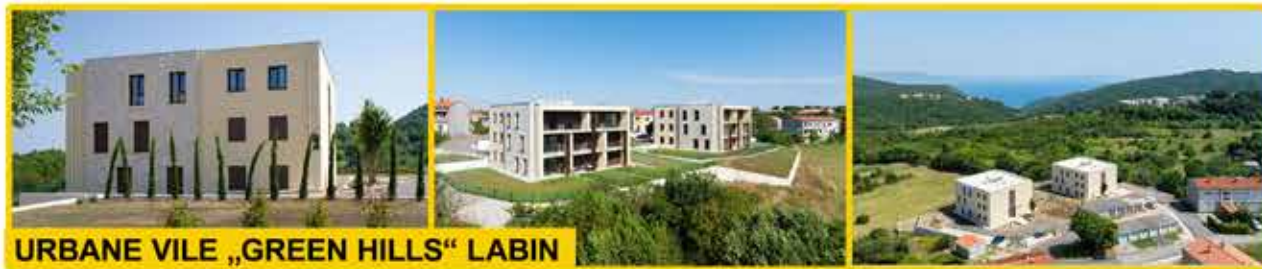
URBANE VILE „GREEN HILLS“ LABIN