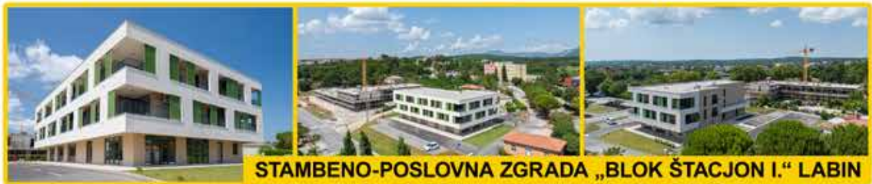
STAMBENO-POSLOVNA ZGRADA „BLOK ŠTACJON I.“ LABIN