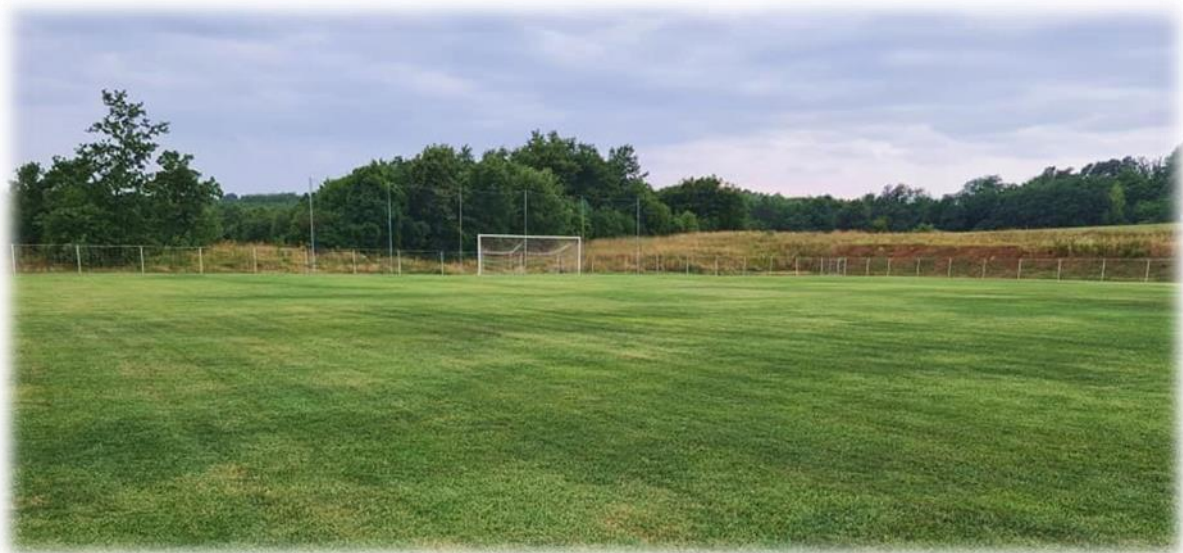
Slika 1. Nogometno igralište Mrzlica Barban

Prema nalazu revizije učinkovitosti upravljanja i raspolaganja nogometnim stadionima i igralištima u vlasništvu jedinica lokalne samouprave na području Istarske županije navedeno je kako se na području Općine Barban nalazi jedno nogometno igralište Mrzlica.