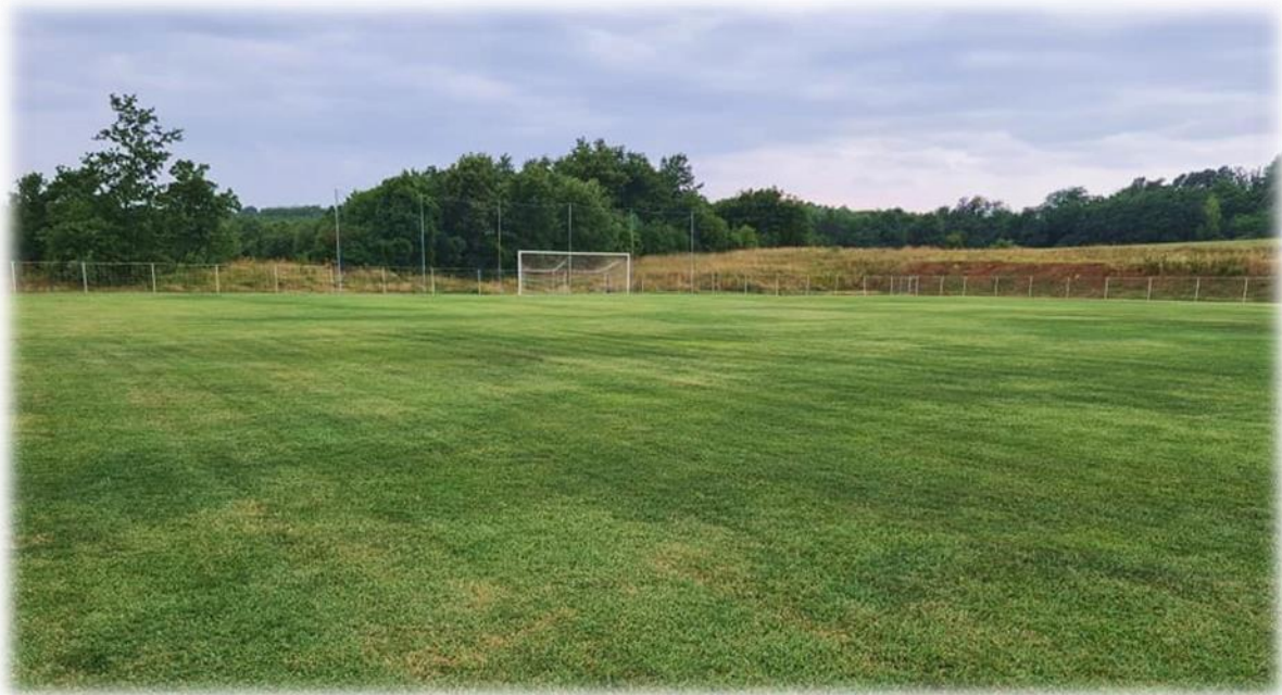
Slika 2. Nogometno igralište Mrzlica Barban

U narednoj tablici vidljivi su podaci o nogometnom igralištu na području Općine Barban te o vlasništvu nad njim prema stanju u zemljišnim knjigama.