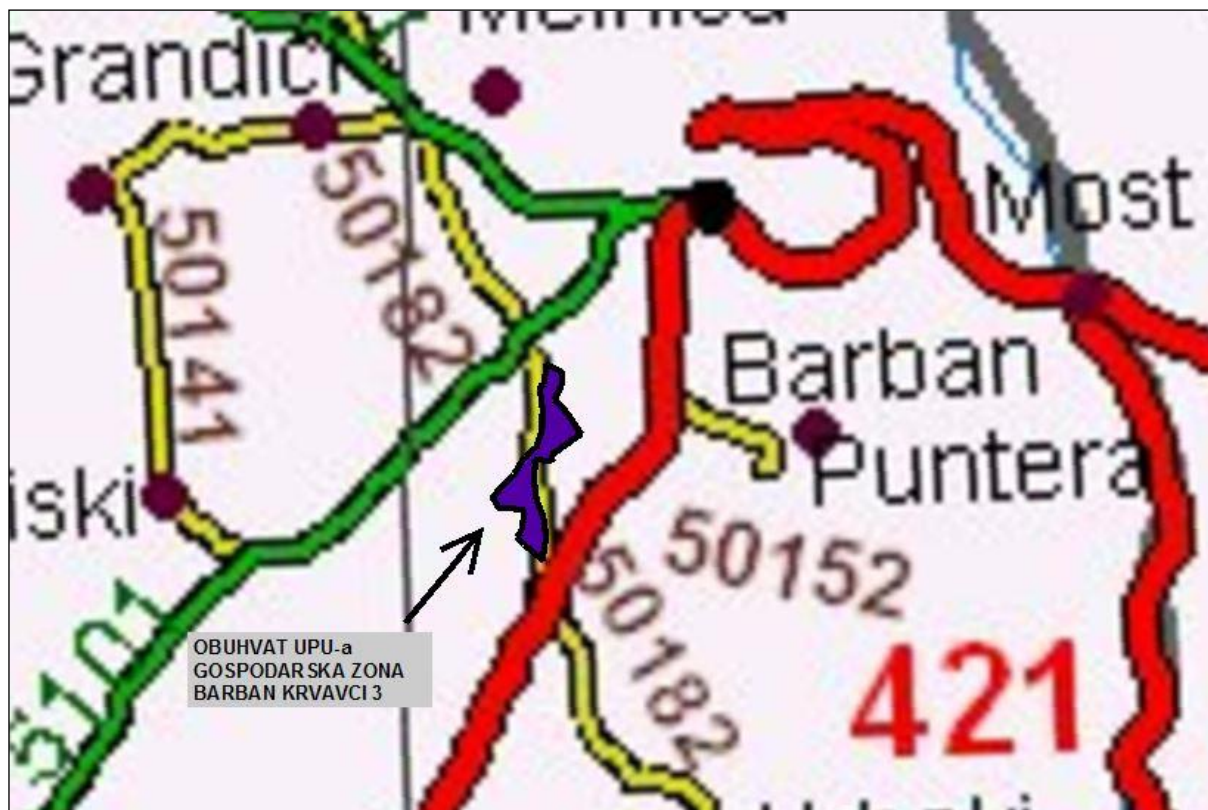
Slika 1 Odluka o razvrstavanju javnih cesta (NN 94/14)

U samu zonu, koja je smještena uz L50182, dolazi se preko izvedene prometnice koja se spaja